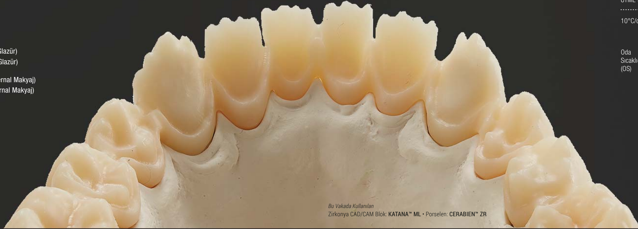
Bu Vakada Kullanılan Zirkonya CAD/CAM Blok: KATANA™ ML • Porselen: CERABIEN™ ZR